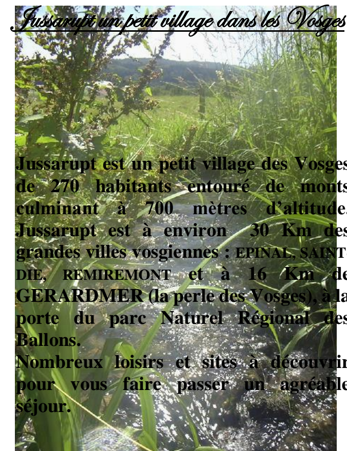
Jussarupt un petit village dans les Vosges

Jussarupt est un petit village des Vosges de 270 habitants entouré de monts culminant à 700 mètres d'altitude. Jussarupt est à environ 30 Km des grandes villes vosgiennes : EPINAL, SAINT-DIE, REMIREMONT et à 16 Km de GERARDMER (la perle des Vosges), à la porte du parc Naturel Régional des Ballons. Nombreux loisirs et sites à découvrir pour vous faire passer un agréable séjour.